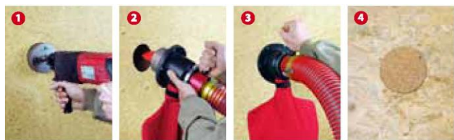
1 При помощи колонкового бура вырезать приточное отверстие 2 Вставить поворотное сопло со стопорной пружины 3 Отжать рукоятку и задуть изоляционный материал 4 Установить пробковую заглушку, закрыв отверстие

при помощи рукоятки для заполнения оставшихся углов. Избыточный вытяжной воздух выводится через перфорированную решетку вытяжного колпака в пылеприемник. В результате, с применением вентилируемого поворотного сопла уровень пылеобразования сокращается до минимума.