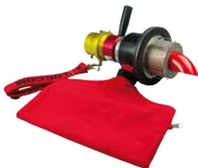
Сопло x-jet со стопорной пружиной