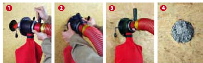
1 Вставить поворотное сопло с фиксатором 2 Фиксируется 3 Выдувание изоляции через закрепленное сопло 4 Приточное отверстие с утеплителем